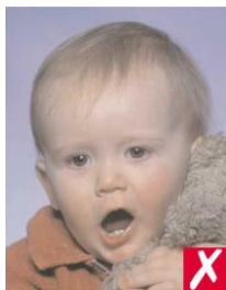
игрушка слишком близко к лицу