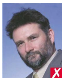
линия глаз под углом