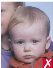
посторонний человек в кадре