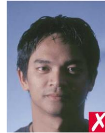
тень на лице