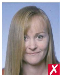
волосы закрывают глаза