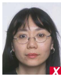
оправа закрывает глаза