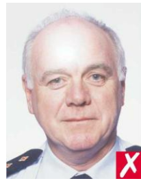
на коже рефлекс от вспышки