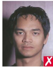
тень на фоне